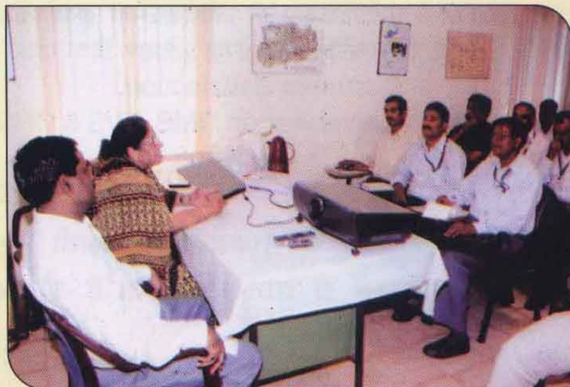
12.09.2009 , एवं 19.09.2009 को Service with Smile विषय पर आयोजित कार्यशला के दौरान उपस्थित कर्मचारीगण