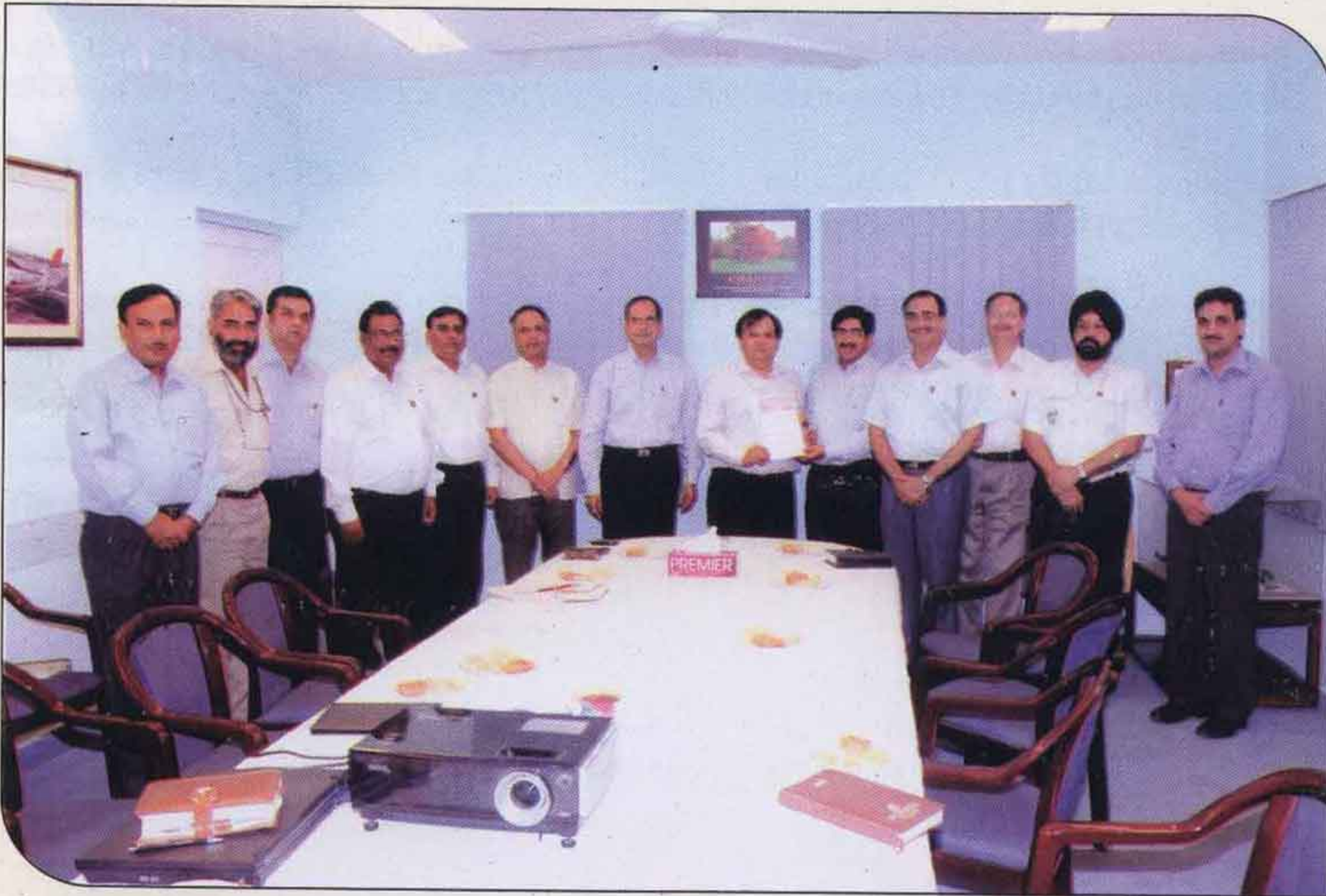
Signing of Contract between PHHL and HAL for Operation & Maintenance of 04 Dhruv Helicopter of BSF